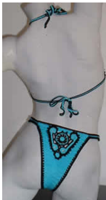
Costume turchese con profili neri ed elementi decorativi bicolori

Prima di iniziare, consiglio di leggere la scheda tecnica relativa all'esecuzione dei bikini presente nella sezione " Consigli "